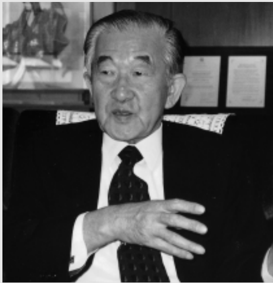
東洋エンジニアリング株式会社