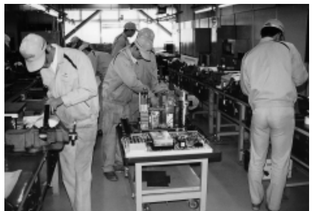
工高3年生の卒業研究実習