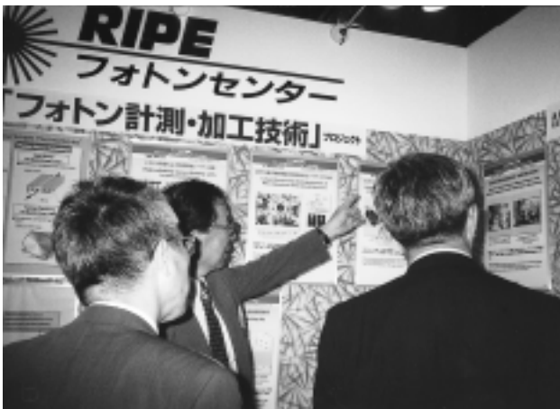
Inter Opto 2000