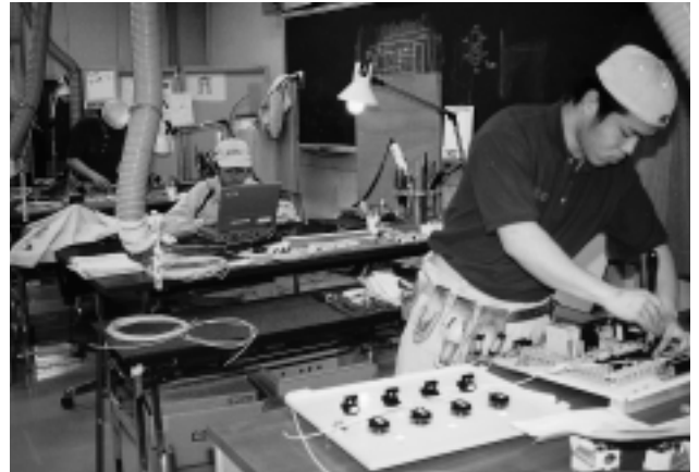
技能五輪 工場電気設備訓練

の品質、納期、量をきっちりと守る生産や保全活動に日夜努力する職場である。技能は、技術の世界の新製品開発、新技術開発のような華々しさはないが、競争力あるモノづくりにとって技術と対等な重要な位置付けにある。