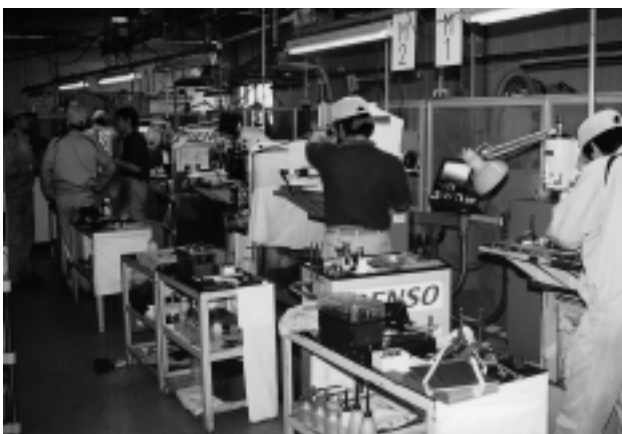
技能五輪 機械加工訓練

同社は内製化設備が大半を占める量産自動化ラインが多い。生産技術部で全体の構想が決定され工機部で設計、製作され、製造部の生産課で使われ、保全部門で保全、修理される。この分野にも工高、高専生、数多くのメカリストを含む技能五輪卒業生が配属されて設備製作、保全部門で活躍している。これがデンソーの「モノづくり」の原点を支える大きな力でもある。