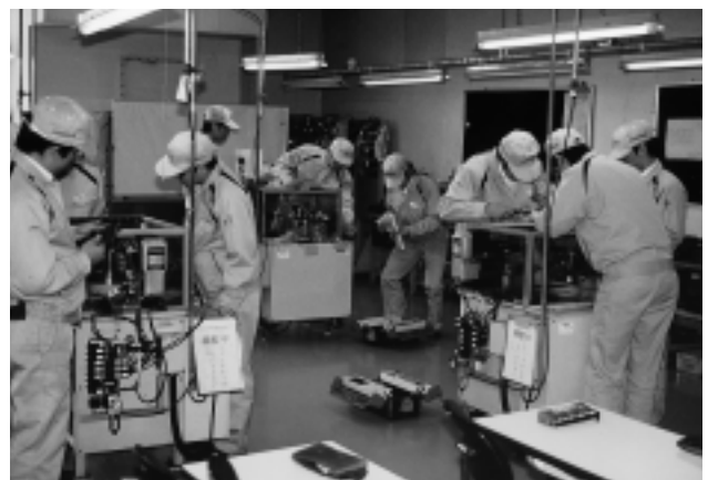
高専生のメカトロ実習

デンソーの製造関連部門に携わる2万5,000人のうち、90%以上が国家検定ないしは社内検定の2級以上の資格を持っている。さらに、国家検定の特級取得者は延べ1,500人ほどおり、国内企業の中でもトップクラスである。「技能という会社の財産を確実に蓄積し、次世代に伝承し普及をはかることをおろそかにしてはならない」と生駒部長はいう。