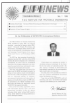
英文ニュースレター

そこで、当センターではこのたび創立2周年を機に、英文のニュースレター「RIPE NEWS (International Edition)」を創刊致しました。今後、年1回以上発行して最新情報を発信し、既発行の要覧や研究成果紹介リーフレット(いずれも和文・英文併記)とともに、国際的なPRに大いに活用する予定です。