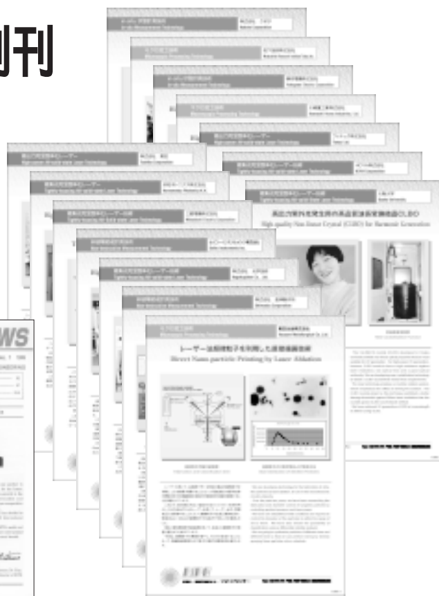
研究成果紹介リーフレット