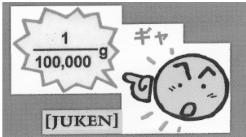
ギヤ「100,000分の1グラム」 (1の左の点が歯車です)

同社は、この歯車の量産技術と同歯車を太陽歯車とする直径1.24ミリの超小型「遊星歯車回転機構」を完成しました。外形1.325ミリのインナー歯車内に収まる遊星歯車回転機構は、この超微細歯車を太陽歯車に、直径0.55ミリメートル、端数21枚の遊星歯車3個の内径1.24ミリのインナー歯車、微細風車などと組み合わせています。一度、超微小歯車の成形システム(4個取り金型)加工方法をご覧ください。