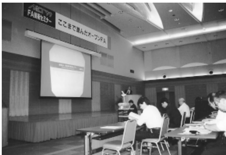
《MECT99》会場で開催された技術セミナー