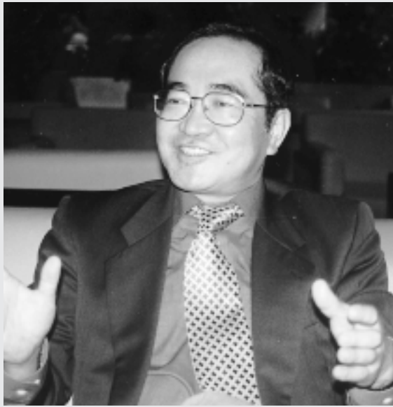
東京都立科学技術大学学長