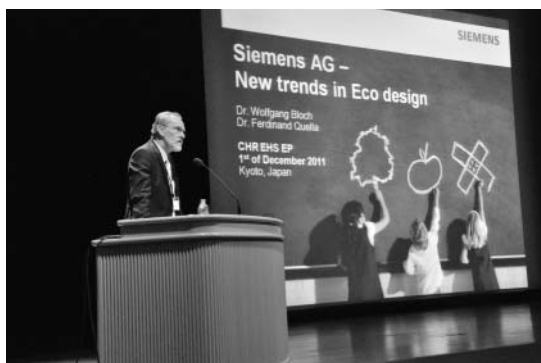
基調講演 Wolfgang Bloch氏(Siemens AG)